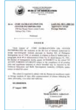
菲律賓移民局SSP認證