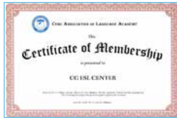
宿霧語言學校協會