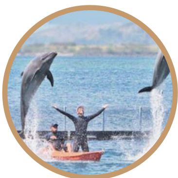
Ocean Adventure 多种多样享受的海洋活动