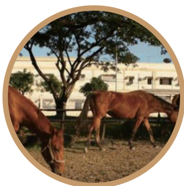
EL KABAYO 可以体验骑马