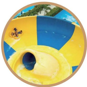
Aqua Planet 玩艺丰富的水上乐园