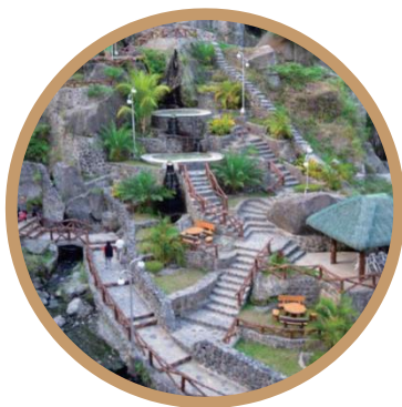
Puning Hot Spring 与风景相伴的温泉浴