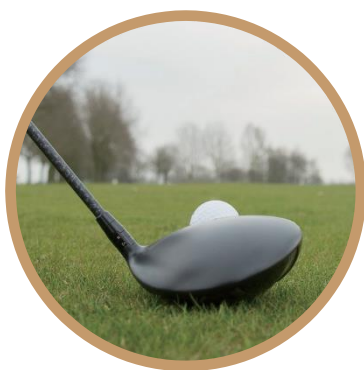
高尔夫练习场&高尔夫俱乐部 近十分钟的路程