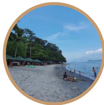
SUBIC BAY 美丽的风景和活动海滩