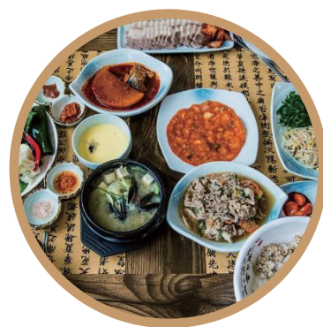
韩国街 韩国餐馆及商店