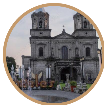
Angeles City Tour 安吉利斯市内观光, 菲律宾著名旅游景点