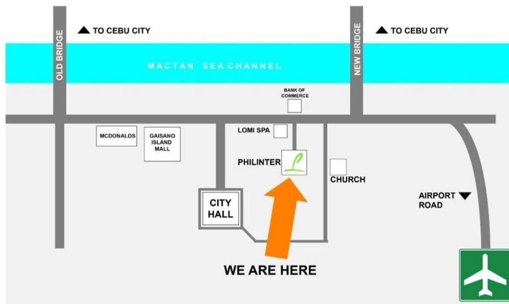
PHILINTER LOCATION MAP M A C T A N , C E B U

要使用 Grab，請搜索 "Philinter Education Center (JELAI)"，將其作為您的目的地。